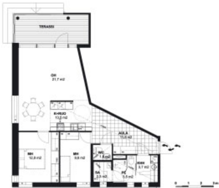
3 Asunto 3H+K+SA, 1. kerros, 82,5 m 2