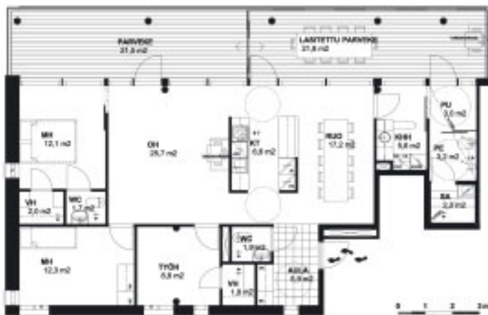
5 Asunto 4 H+K+RUO+SA, 4. kerros, 114 m 2