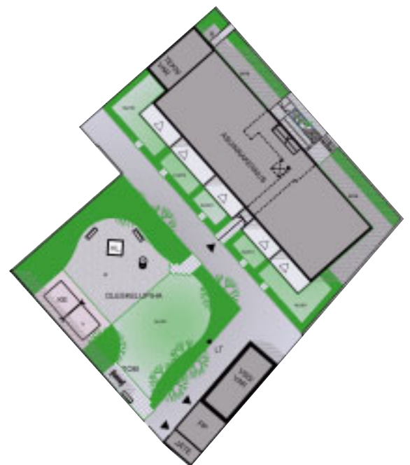
6 Tontin pihajärjestelyt.