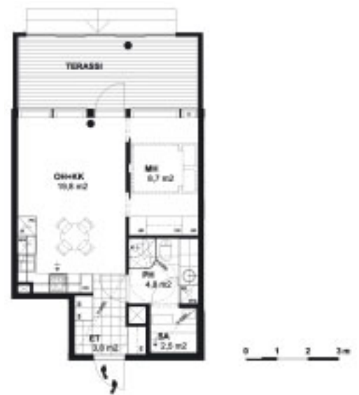
4 Asunto 2H+KK+SA, 1. kerros, 40,5 m 2